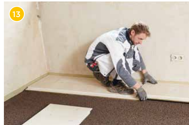
13 Verlegen Sie die Rigidur EE reihenweise im Längsverband.