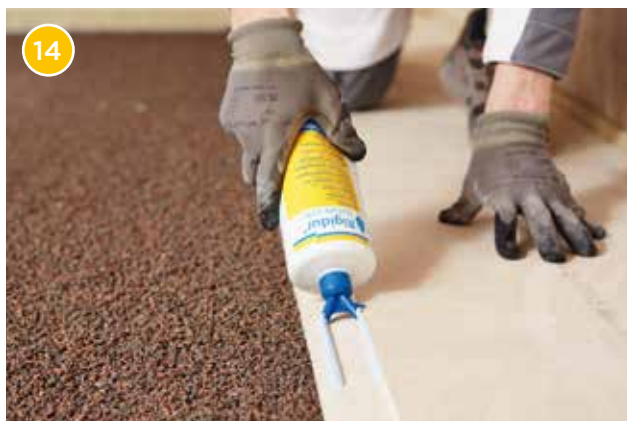
14 Bringen Sie den Rigidur Nature Line Estrichkleber mit der Doppelstrangdüse auf der Plattenkante sowie auf dem Stufenfalz des Rigidur Estrichelements auf.