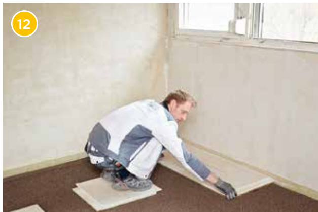
12 Beginnen Sie nun mit der Verlegung der Rigidur EE in der hinteren linken Ecke des Raumes. Legen Sie ggf. Trittschichten aus Rigidur EE aus, um die Trockenschüttung nicht zu betreten.