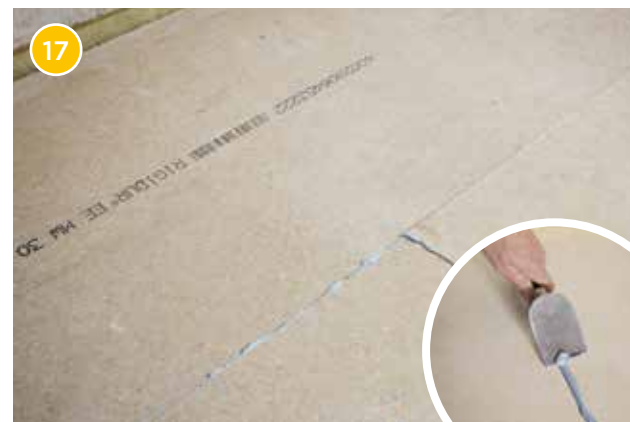
17 Für eine glatte und ebene Oberfläche stoßen Sie überschüssigen Kleber fugenbündig ab. Nach ca. 24 Stunden ist der Kleber komplett ausgehärtet und der Trockenestrich kann mit den gewünschten Bodenbelägen versehen werden.

Jetzt kennen Sie das Geheimnis hinter attraktiven Böden!