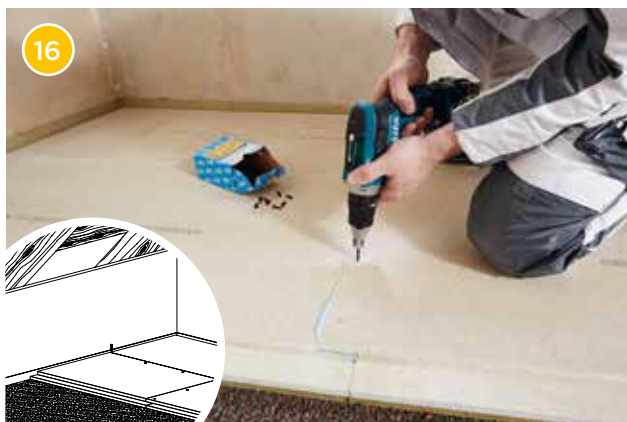
16 Verbinden Sie die Rigidur EE im Bereich des Stufenfalzes mit Rigidur Spezialschrauben im Abstand von ca. 25 cm.