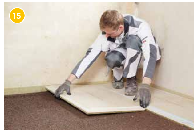
15 Verlegen Sie nun weitere Rigidur EE und verschrauben Sie die Rigidur EE reihenweise im Verlauf. Die Querstöße der Elemente sind um mind. 20 cm zu versetzen.