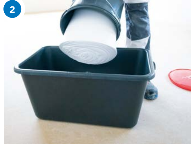
Den Rigips ProMix Airless einfach wie eine Teigkugel in eine Mörtelwanne kippen