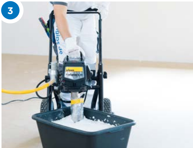
Airless Ansaugrohr in die Masse tauchen